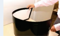
次世代型太陽電池